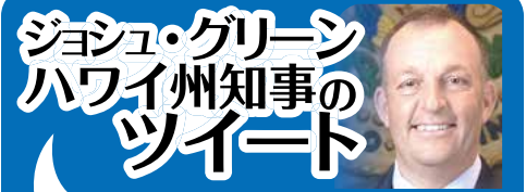
Governor Josh B. Green @GovJoshGreenMD