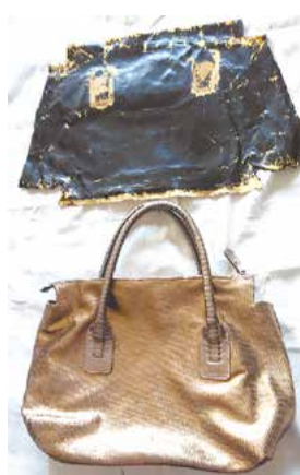
修理バッグのBefore & After

黒のエナメルバッグの糸をほどき全てを解体して分解したパーツ自体を使い型紙を作りました。保存していた金茶の革を広げ型紙を置きましたら、なんとか出来そうな面積がありました。取っ手はエナメルではない革で、まだまだ十分使えそうなので活かすことに。底面は、真ん中で革を縫い縫いました。全く不自然ではない