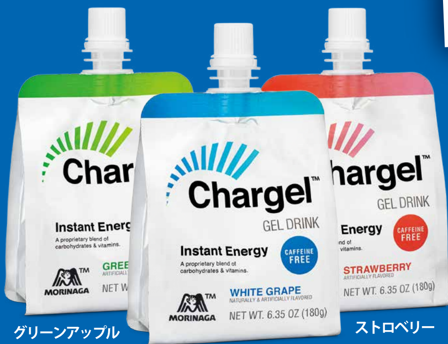
グリーンアップル