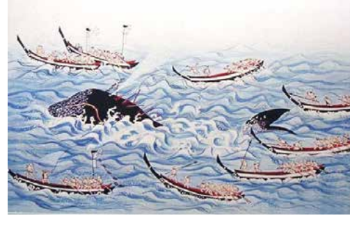
網取り式捕鯨(小川嶋捕鯨絵巻)

る網舟(あみぶね)、2隻組で捕獲したクジラを挟み込み曳航する持双舟(もっそうぶね)などの小舟で格闘したのです。 しかし、江戸時代後期に入ると、日本近海に押し寄せた米国の捕鯨船によるクジラの乱獲で、資源枯渇の状態が顕著になったと言います。 日本人にとってハワイ先住民がそうだったように、クジラは「海の幸」としての天からの恵みであり、生き物をいただくことへの感謝の思いを忘れませんでした。クジラの供養塚や供養碑は、特に江戸時代のものがもっとも多く発見されていますが、背景には困窮する庶民生活に欠かせない食料であったからなのでしょう。 日本人にとって鯨食は、日本史の長きに渡って、さらに大戦後の食糧難の時代を救ってきました。鯨肉は栄養価が高く安価な食材であったため、庶民の食生活を支え、学校給食でも子どもたちの健全な発育のための大切な栄養源になったわけです。1960年ごろまでの日本国民一人あたりのクジラ食肉供給量は、牛肉、豚肉、鶏肉を上回っていたのです。