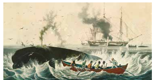
19世紀の南洋での捕鯨の様子を描いた石版画

やがて、一世を風靡した太平洋での捕鯨によって乱獲されたクジラが激減するようになります。さらに原油が採掘されるようになり、欧米における太平洋上での大規模な捕鯨時代は終焉を迎えハワイの寄港地としての役目も終わりを告げるようになります。その後のハワイでは、サトウキビの大規模な栽培が始まっていきます。