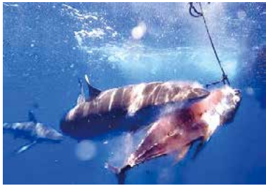
マグロ漁船の漁法として延縄(はえなわ)という40キロの長さ

シャチは何頭もの集団で泳いでいてマグロを狙ってきますが、サメの場合は一匹でも襲ってきて、マグロの一部、腹の部分に一番先に噛みつき、頭の部分は残すそうです。せっかく釣り上げたマグロのもっとも美味しいところが噛みつかれていたりすると、漁師にとってはたまったものではないですね。競り場でも二束三文の値段になってしまうのですから。