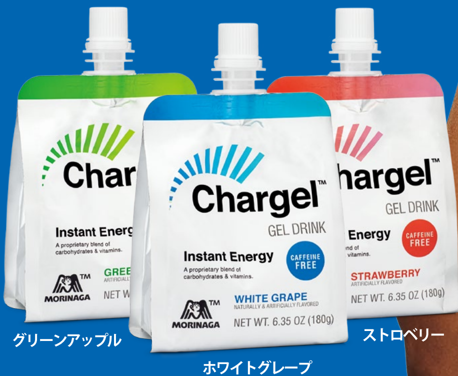
グリーンアップル