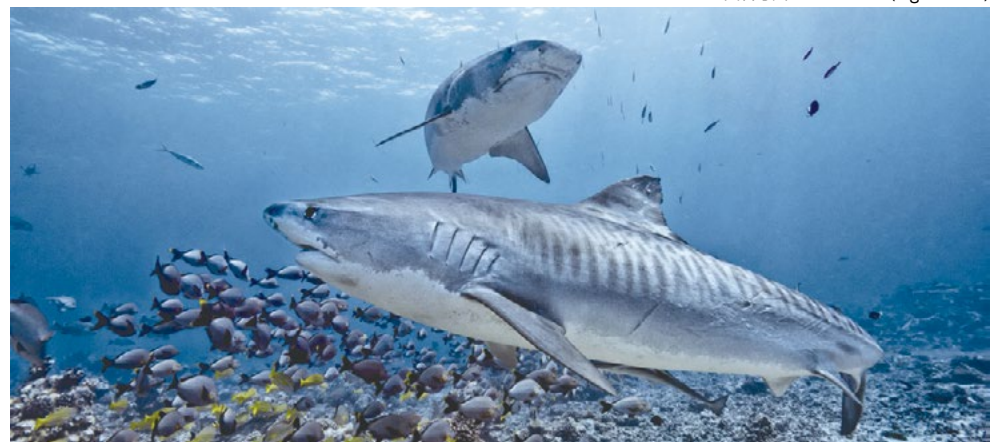
資料写真：イタチザメ (Tiger shark)

ハワイ州土地自然資源局(DLNR)のウェブサイトによると、ケワロ湾で最後にサメの襲撃が報告されたのは2002年である。海洋専門家は、最近の雨模様天候が今回の事件の一因になった可能性があると述べている。