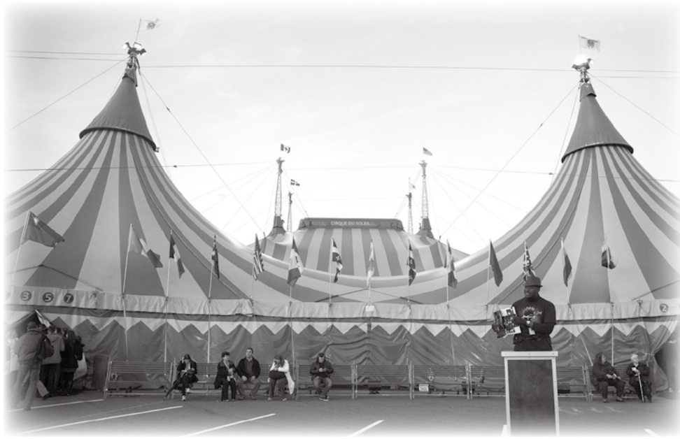
資料写真：Cirque du Soleil circus tent at Citi Field in New York on April 8, 2014.