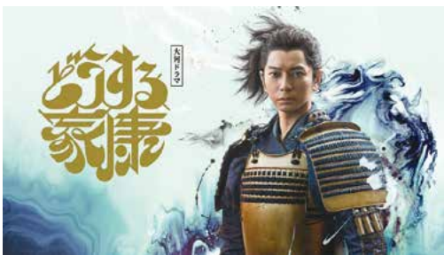
木村 伊量 (きむら・ただかず)

あちこちに媚(こ)びることなく、国営放送ではなく、公共放送としての気骨ある矜持(きょうじ)を取り戻してほしい、と願うばかりです。