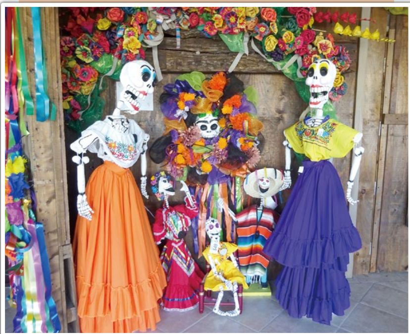
大地さん テキサスのサンアントニオの民芸店(フィエスタ)