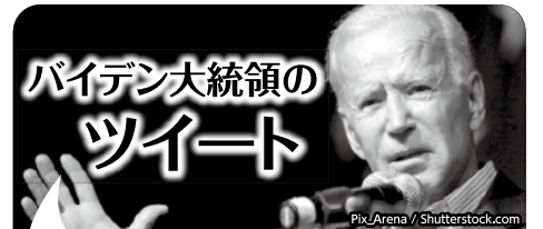
Joe Biden @JoeBiden