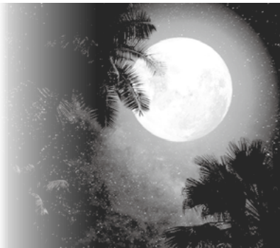
参考:(ホノルルのムーンカレンダー)https://www.almanac.com/

日本でもかつては太陰暦が使用されていましたが、古代のハワイ人たちが月の満ち欠けによるカレンダーを作ることによって季節や時間を把握し、漁業や農業に役立てていました。ネイティブアメリカンは季節に合わせて、特色ある呼び名をつけていたようです。今年のネイティブアメリカン満月カレンダーをご紹介します。