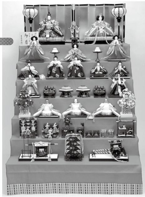
一般的な七段飾り

ひな祭りといえば「ひな人形」。最近では住宅事情やインテリアの趣味などの理由で、コンパクトな内裏雛だけを飾ることが多くなりましたが、本格的な七段飾りは豪華絢爛、平安貴族の生活様式もうかがわせませす。現在のような人形になったのは江戸時代だと言われていますが、並び方や衣装、小道具にはどんな意味があるのでしょうか。深掘りしてみませんか？