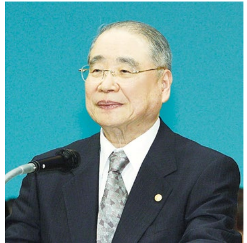
富士大石寺顕正会会長 浅井昭衛 著