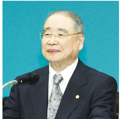
富士大石寺顕正会会長 浅井昭衛 著