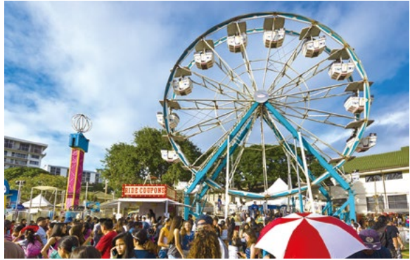
資料写真：2014 Punahou Carnival

ステートフェアは、5月27日からアロハ・スタジアムで開催されることになっている。