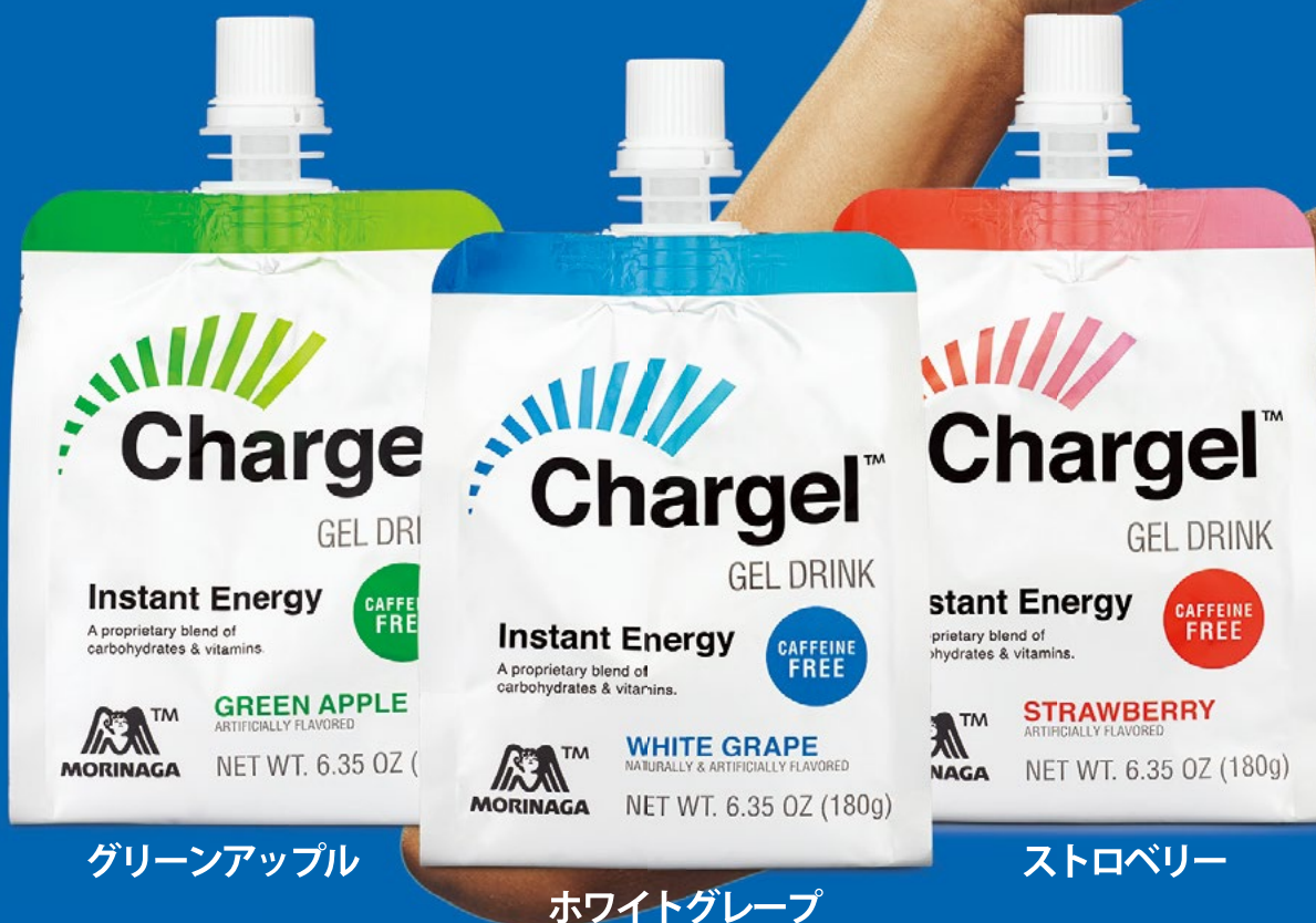
グリーンアップル