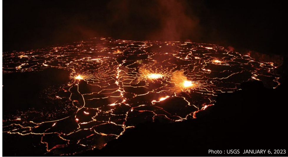
JANUARY 6, 2023

マウナ・ロア火山の噴火が停止し、噴火活動が見られるとは期待していなかった多くの観光客は、キラウエア火山の噴火に喜び、夜の暗闇の中で赤々と輝く溶岩の様子に感嘆の声を上げていた。