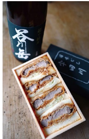
Text & photo ©Richi Ohashi 禁無断転載