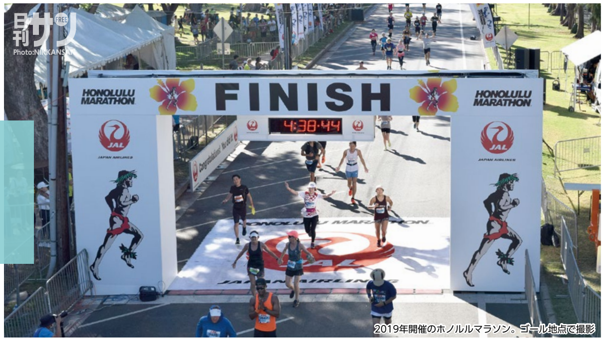
2019年開催のホノルルマラソン。ゴール地点で撮影