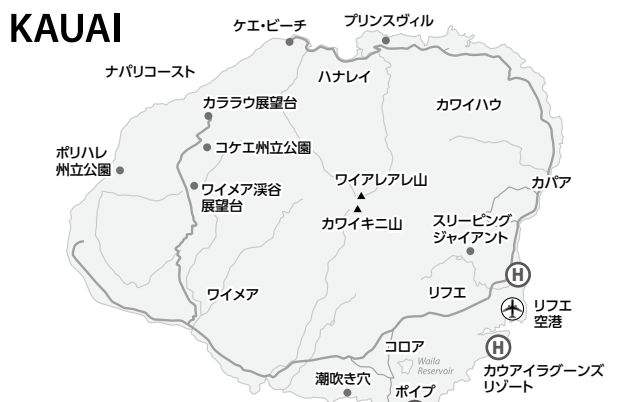
「Westin」は地図のカウアイラグーンズ・リゾートに、「Kauai Hilton」はワイア川(カウアイ川)の海側、「Kauai Sheraton」は南のボイブ・リゾートのところにあった(30年前なので、現在のホテル名は異なる)