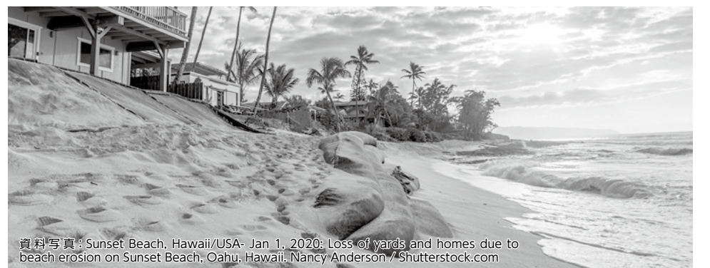
資料写真: Sunset Beach, Hawaii/USA - Jan 1, 2020: Loss of yards and homes due to beach erosion on Sunset Beach, Oahu, Hawaii.