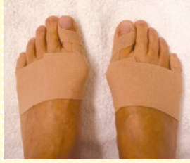
巻き爪がここまで改善