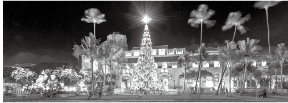
資料写真：December 2, 2018: Honolulu City Lights is a month long Christmas lights and decorations display at Honolulu Hale. Phillip B. Espinasse / Shutterstock.com

このクリスマスツリーの点灯式は、ホノルル・シティ・ライトとホノルル・エレクトリック・パレード開催式と共に12月3日に行われる予定となっている。