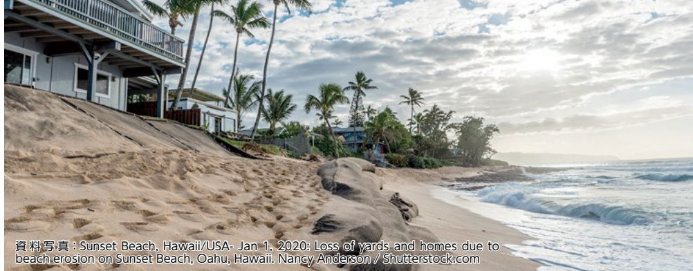
資料写真: Sunset Beach, Hawaii/USA- Jan 1, 2020: Loss of yards and homes due to beach erosion on Sunset Beach, Oahu, Hawaii.

発生する強いうねりは、サンセット・ビーチやエフカイ・ビーチなどの海岸線沿いに建つ住宅に侵食などの影響を及ぼしている。敷地内のビーチを維持するため、土嚢、タープ、コンクリート、鉄筋壁などを設置している住宅もあるが、これらの設置は法に触れる可能性もある。ハワイ大学シー・グラント・プログラムの調査によると、ハワイでは今世紀末までに、海面が91~183センチ上昇する可能性があるという。