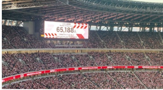
サッカーの試合を抜き、国立競技場最多、超満員の6万5188人が入場

NZの人口比は、2019年の調査では欧州系が最多の70%ですが、マオリ系は16%、太平洋諸国系は8%、アジア系が15%とハワイ同様の多民族の構成です。神聖なハカの儀式にも、古典フラの「カヒコ」に通じる精神を感じますが、試合前に歌唱されるNZ国歌の中には「Aroha」の歌詞が登場します。スペルこそ、ハワイのAlohaと違いますが、意味は同じで他にもマオリ語で水はハワイ語と同じ「Wai」、太平洋も「Moana」と同じです。