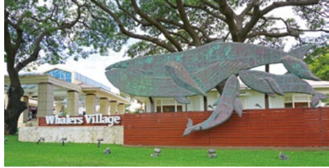
資料写真: Whalers Village, EQRoy / Shutterstock.com

一方、オアフ島で住民よりも観光客が多い場所は、ドール・プランテーション、クヒオ・