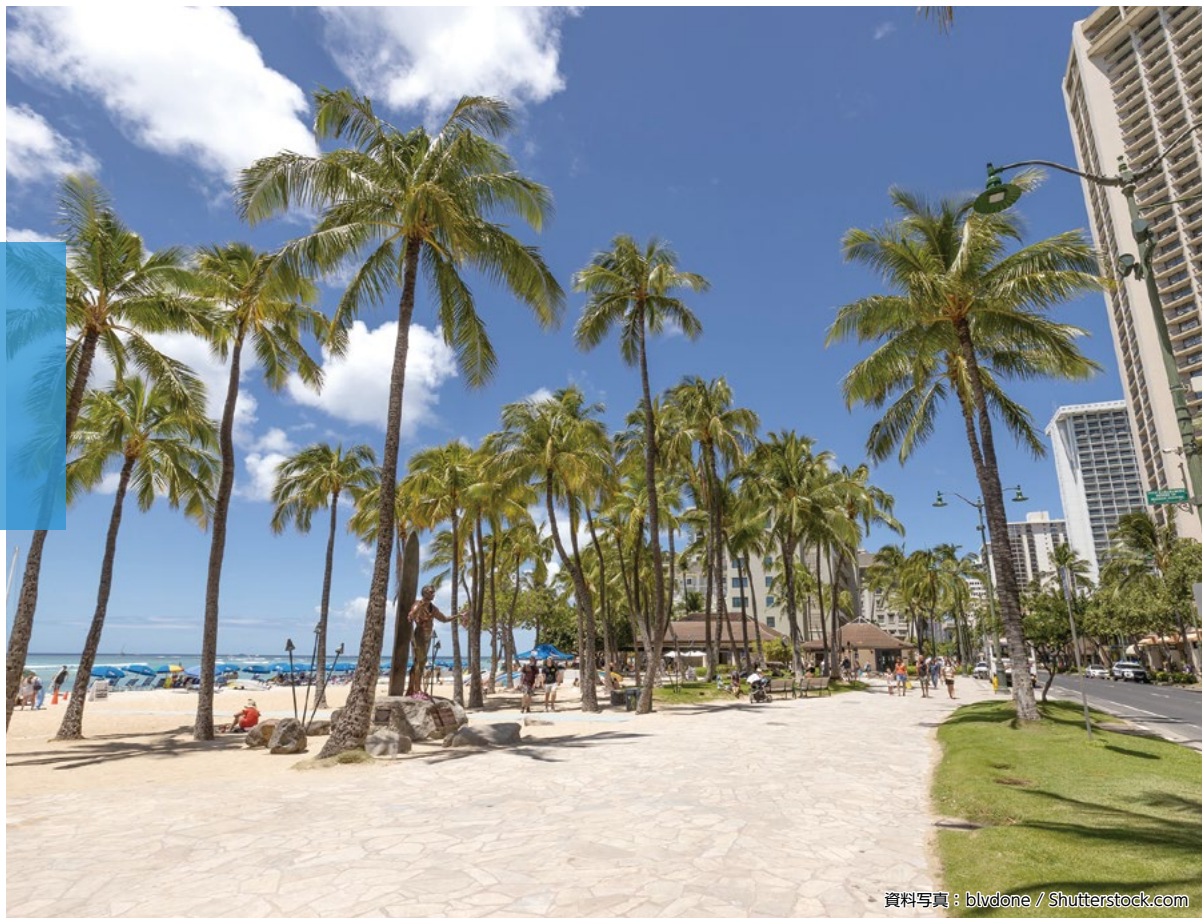
資料写真: blydone / Shutterstock.com