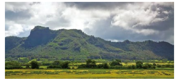
ハリケーン前のスリーピング・ジャイアント

3:30PM 空港に急いで走る。乗れるかどうか分からない。ダメでもいい。ダメならまた戻ればいい。空港に着いた。400名近い列だ。心配だ、本当に乗れるのか。空港のアナウンス。搭乗券はなし。先着順。ハワイアン航空が発券している搭乗券に名前を書く。そしてGOだ! お客様に列に並んでもらって、オフィスに向かう。これで2回目だ。今日はフラッシュライトを持ってきている。非常灯がついていた。恐る恐るオフィスのドアを開ける。何日ぶりだろう。薄暗い。なじみのある風景が目に入る。窓をチェックする。割れていない。異常なし。全ては11日に出たまま。ほこりが一面机の上に落ちていた。安心した。電話をピックアップする。何の音もない。オフィスを出て列をチェックしに行く。列の中を探す。いない。乗ったのだ。長い列だ。これで一件着着。