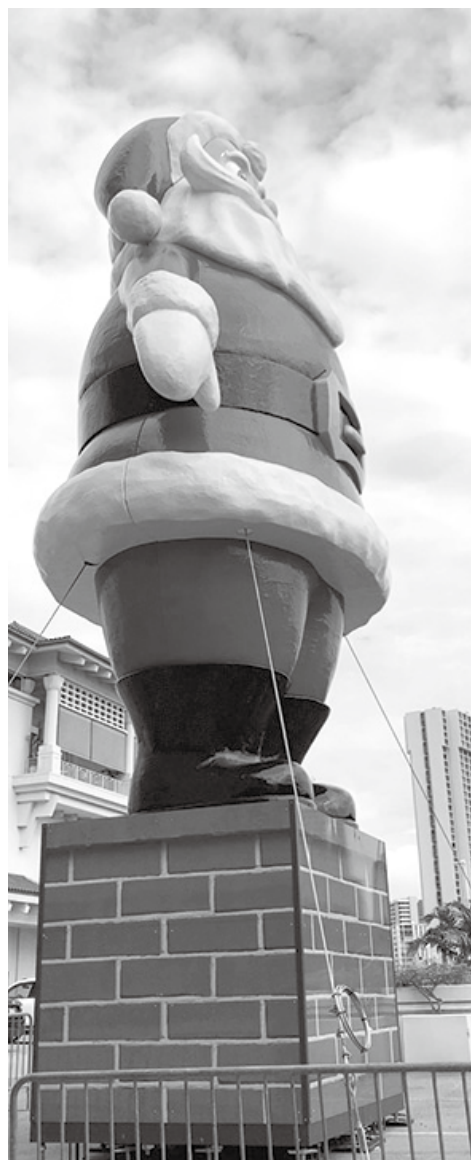
アラモアナ・センターの駐車場に設置された「ビッグ・サンタ」