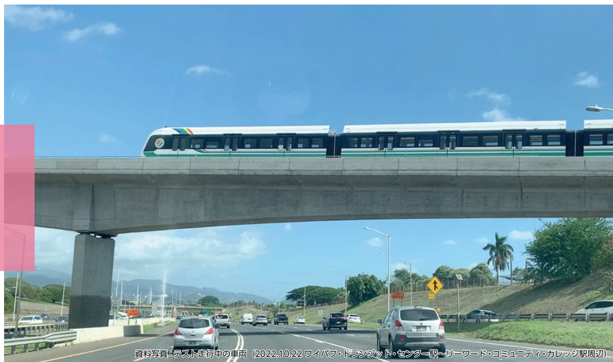
資料写真: アストロ走行中の車両 (2022.10.22 ワイパフ・トランジット・センター駅~ローワード・コミュニティ・カレッジ駅周辺)