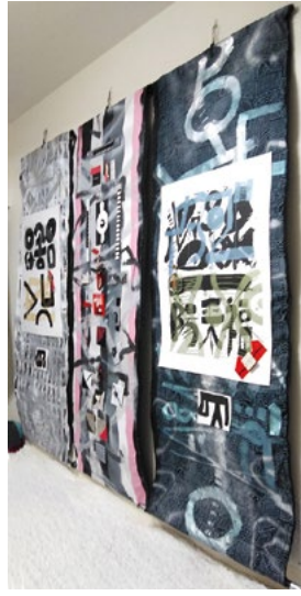
タイトルは《磁在遊戯(じざいゆうか)》、ドア1枚分が三つ

しかし、私の住まいは小さいので、大きな作品を増やすわけにはいかないのです。勿論倉庫を借りて保管などできる余裕もありません。なのに、創ってみたいくな