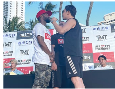
メイウェザー選手(左)と朝倉未来選手(右)

最後の写真撮影で対峙した時も、メイウェザー選手サイドの付き人が、朝倉選手をつきとばし一発触発なシーンもあり、すでに相手を挑発する戦略が始まっていた。こうしてまた25日の試合へのボルテージを上げ、ファンたちの期待の炎も焚きつけた。