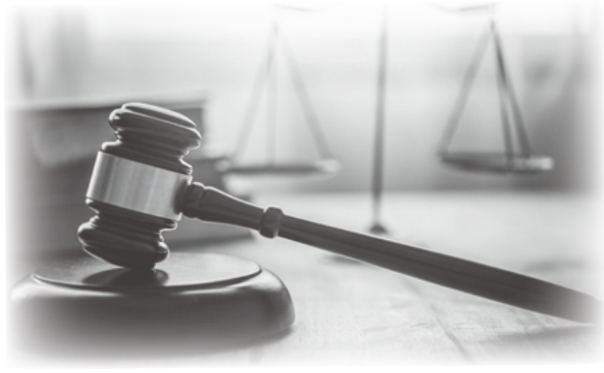
失致死罪や暴行罪など、より軽度の罪で有罪になる可能性がある。