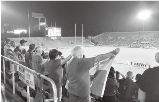
コロナ禍で無観客が続いていた国際試合でしたが、客席にファンが戻りアイルランドを応援する大旗も

前回に続き女子ラグビーのおはなしを…。まさに真夏の夜の夢のような時間でした。8月27日にラグビーの聖地、東京・秩父宮ラグビー場で行われた女子ラグビーの日本対アイルランドで、日本が7度目の挑戦にして、初めて格上の強豪アイルランドに勝利!見守った4569人の観客がピッチの上の選手に心を重ね、歓喜で魂