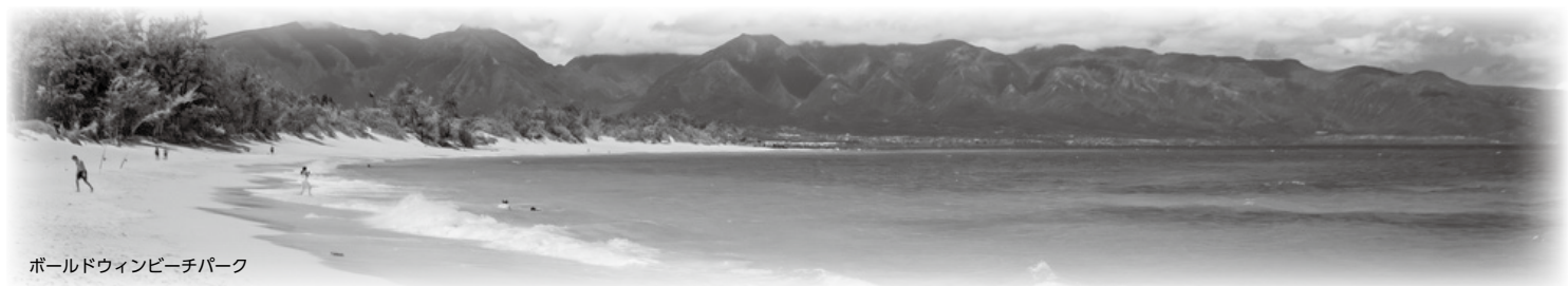
ボールドウィンビーチパーク