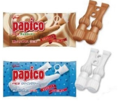
画像 (マーカー):ウイグルランド社のウェブサイトより (消しゴム):おもしろグッズのウェブサイトより

これらは、面白いだけでなく、オシャレな文具としても好評のようです。グリコの「パピコ」型のダイカット消しゴムで、包装も可愛くてギフトやプレゼントに最適のようです。おもしろ文具は、お気に入りを入れて楽しむこともできるようです。値段は300円程度で、気軽に買えるお値段ですね。ちなみに、ペコちゃん消しゴムもあり、220円だそうです。市場では、なんと、1000種以上の消しゴムが販売されており、用途、好みによって、よりどりみどりで。