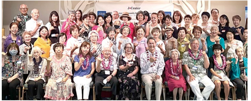
役員やメンバー、ゲスト、70人以上が集って