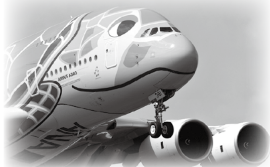
資料写真: "Flying Honu" viper-zero / Shutterstock.com