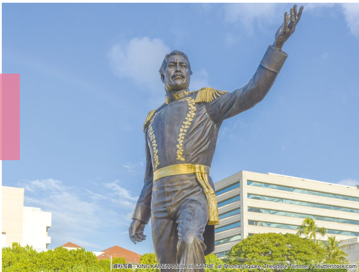
資料写真: KING KAMEHAMEHA III STATUE at Thomas Square, Theodore Trimmer / Shutterstock.com

日経平均 27,993.35 +191.71 NYダウ 32,827.01 -18.12 ドル/円 131.64 (8月1日 午後7:36 UTC)