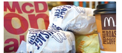
参考写真: Shutterstock, TY Lim/Penagg, Malaysia, 2017

オーストラリアは害虫や疫病の侵入から農業を守るため、非常に厳しい検疫制度を設けている。特に現在は、インドネシアで口蹄(こうてい)疫が発生したことを受けて警戒態勢が敷かれており、同国から輸入される食肉すべてが検査対象となっている。