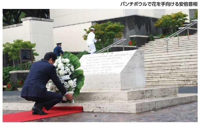
パンチボウルで花を手向ける安倍首相