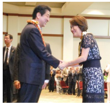
ドーン州知事夫人(右)にレイを掛けられ、握手をする安倍首相