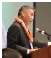
「日本とハワイは家族の関係だ」とあいさつしたイゲ州知事