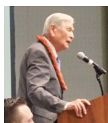
「個人的にも安倍首相を尊敬する」と話したアリソン元州知事