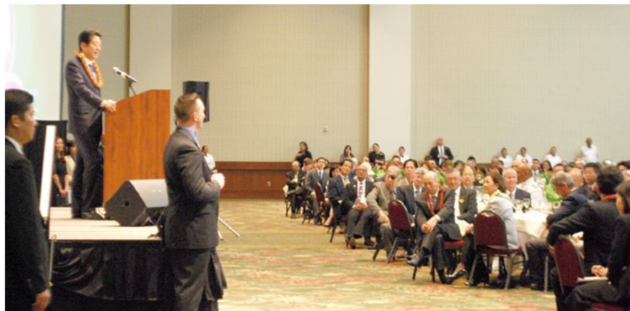
レセプションで安倍首相は約1,000人の招待客を前に20分を超えて言葉を述べた

首相は、「明治元年以来、多くの方が夢を抱いてハワイに移られ、過酷な労働の現実と直面し、それでも次世代に夢を託すべく乗り越えたと聞いている」と話し出し、「マキキ日本人墓地に立ち寄った時、先人たちに思いを馳せた。75年前にはじまった戦争で、日系二世の方々自身が育った国であるアメリカに忠誠を誓い、家族のために戦った。日系人の方々には日本人としての誇り、そしてアメリカ人としての誇りを持っている。日米の架け橋としての大きな活躍に心から敬意を表したい」と述べた。