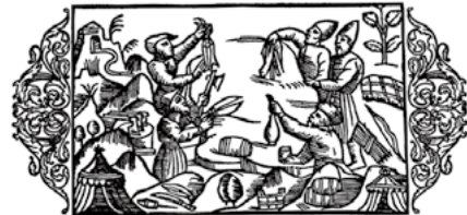
物々交換をするスカンジナビア人とロシア人(16世紀)

食糧と食料ではないものが交換されることもあったようですが、このやり方には欠点がありました。まず、自分の持っているものを交換する相手が必要ない場合、相手が持っているものと交換することができず、食糧同士を交換する場合、鮮度の違いなどから価値が不釣り合いになるという支障が生じることもありました。