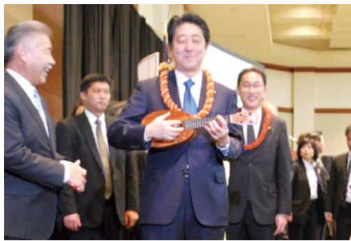
イゲ州知事より贈られたパイナップル型のウクレレを弾くマネをする安倍首相

ハワイ式の祈りであるハワイアンチャントが披露された後、首相がステージに立った。「アローハ!」とあいさつすると、会場からは大きな声で「アローハ」と歓迎の言葉が返ってきた。