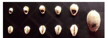
古代中国の宝貝の貝貨。古代中国では、宝貝は豊産や死者の安寧と結びつく神聖なものとされていた

古代中国では貝を使った物品交換が盛んでしたが、「貨」「財」「貯」など、お金関係の漢字にしばしば「貝」が入っているのはそのためです。しかし、物品交換にも次のような欠点がありました。貝、布、塩などの「自然貨幣」は物品交換をしなくても手に入れたり製造することができるという点、また、砂金は金・銀の配合率を変えて偽造することができたため、正しい価値で取引することが難しいという点です。