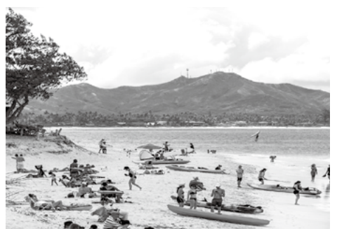
資料写真: People on the beach, Kailua Beach Park

「サーフライダー・ファンデーション」という団体では、祭日の次の日にビーチの清掃作