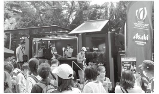
ラグビーW杯の新「公式ビール」となったアサヒスーパードライ。販売カーの前も大行列

フランスとの2戦目は、東京五輪の舞台となった新国立競技場に5万人以上の観客が見込まれています。ジャージの左胸に三輪の桜があらわれ、「Brave Blossoms」の愛称を持つラグビー日本代表。来年の世界最高峰の舞台に向けて、「Go with the brave」の合言葉とともに強化の日々が続いています。