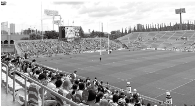
久しぶりに東京で開催されたラグビーのテストマッチ。梅雨空の下、たくさんのファンが訪れました

日本と同様に、来年のW杯の出場が決まっているウルグアイですが、世界ランク10位の日本に対しウルグアイは19位。W杯