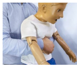
資料写真: Abdominal thrusts (the Heimlich maneuver or Heimlich manoeuvre) on a simulation mannequin child dummy during medical training Basic Life Support