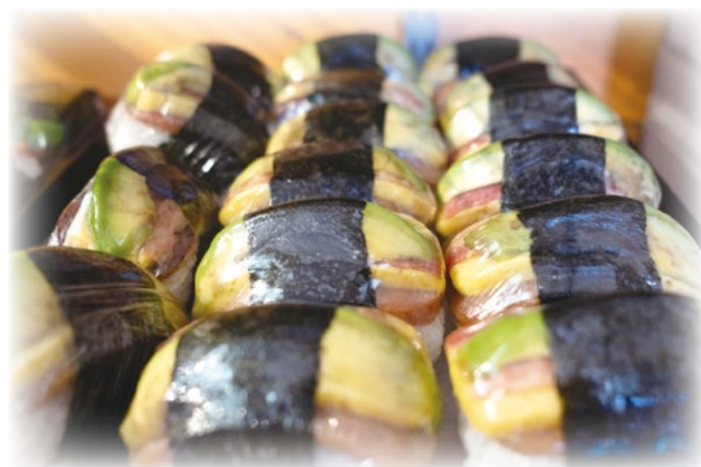
のスパム製品が消費されているという。