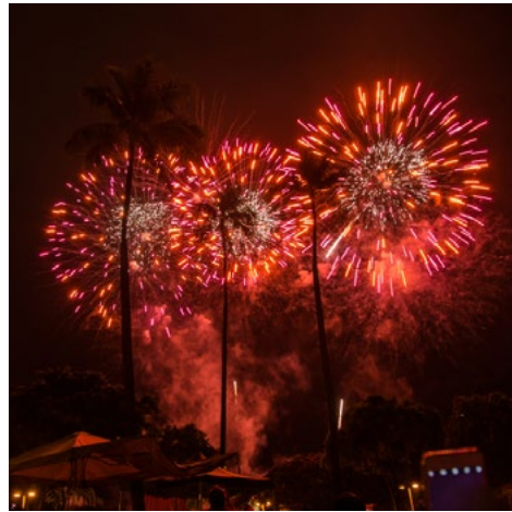
資料写真: Honolulu, Hawaii, USA - July 4th, 2019: Fireworks at Ala Moana Beach on National Day.

https://www.alamoanacenter.com/en/events/4th-of-july.html