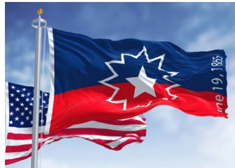
れていたが、今年から連邦政府の祝日となった。