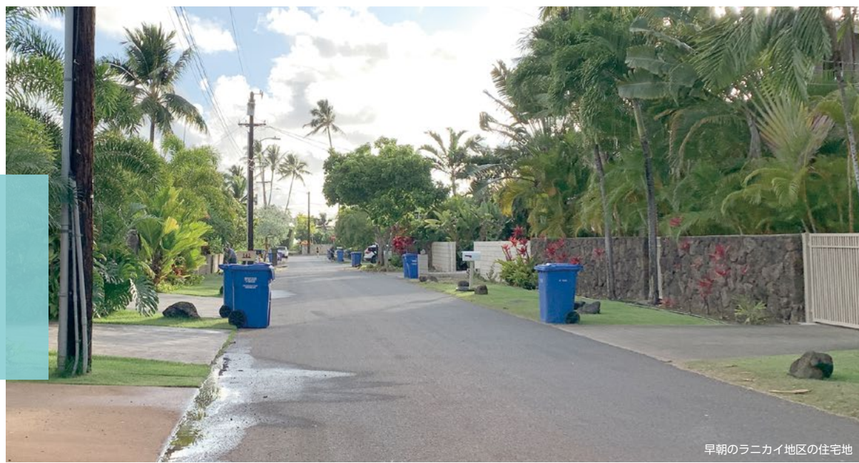
早朝のラニカイ地区の住宅地