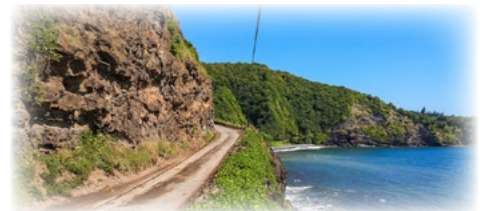
資料写真：マウイ島の南東にあるハナハイウェイの終わり - 太平洋に沿った曲がりくねった海岸の未舗装の道路

パイアを通過してハナまで続く道を利用するのが大半だが、キパフルを通る裏道を利用する人も少なくない。