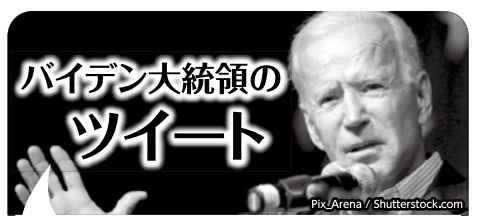
Joe Biden @JoeBiden

5月27日 8:23AM 私は皆さんにグッド・ニュースがあります。オーストラリアのバブ社によって製造された安全な乳児用ミルク2,750万本がアメリカ合衆国へ輸送されてきます。できるだけ早急に少しでも多くの乳児用ミルクが店舗の棚に並ぶよう全力を尽くしています。