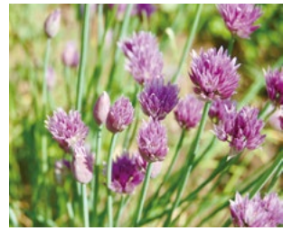
紫色の花をつけるチャイブ。和名ではエシネギとも呼ばれる。