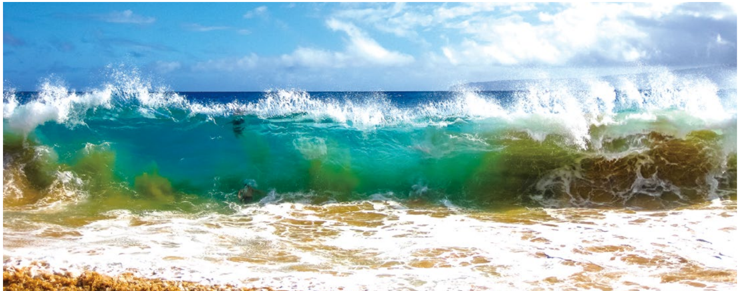
High waves of the famous Big Beach in summer, Makena State Park in Maui, Hawaii, United States.

この事件に関しては、2017年5月19日に地方裁判所での最終判断が下されていたが、その後、州裁判所に控訴されており、今回の判決は2022年3月31日の控訴却下を支持した。 日刊サン 2022.5.3配信