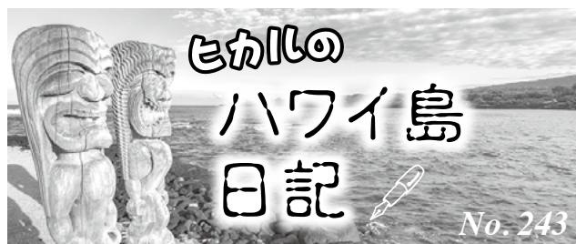
ヒカルの ハワイ島 日記 No. 243

明らかにしたことと感謝すると語った。また、ウクライナ南東部マリウポリのロシア軍に包囲されているアゾフスターリ製鉄所からの民間人の避難を認めることを検討するようプーチン大統領に要請。プーチン大統領は人道回廊の設置を確約したとした。