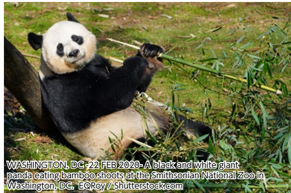
WASHINGTON, DC - 22 FEB 2020 - A black and white giant panda eating bamboo shoots at the Smithsonian National Zoo in Washington, DC.

ギネス記録によると、今まで最も長寿のパンダは、香港のオーシャン・パークで飼育されていたもので38歳まで生きたという。