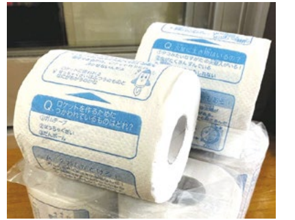
画像: 理科ロールの現物: 東京都葛飾区の西亀有児童館にて展示

た資金で、3000ロールを試作し、東京や川崎の小学校や児童館に寄贈し始めました。写真は西亀有児童館に贈られたもの一部で、受け取った職員は、「苦手意識があっても、プチ情報があると科学を楽しめるはず。だけど、みんなトイレで長居してしまいそうですね!」と言ったそうです。