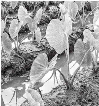
タロイモ(カロ)の畑

オアフ島に最初に住み着いたハワイアンたちは、湧き水や湖、河川、浅い井戸などから水を得ていました。驚くべきことに、数十万の人々が、大地と水の資源をすでにとても賢く利用していたのです。水源には厳しい規則がしかけていました。「カナヴァイ」という水に関する法律は、最終的に島の法律になっています。水をくみ出してよいのは河川の上流だけで、入浴には下流を利用します。水資源の保護は、島の重要な法律でした。海水に囲まれた島に住むハワイアンたちは、限られた水資源の大切さをよくわかっていたのです。