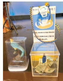
ウクライナへの募金も

NPO主婦ソサエティー・オブ・ハワイ、設立56周年の祝賀会および年度総会が3月20日に開催された。ロイヤル・ハワイアンホテルのボールルームには260余人の会員やゲストが集まり、コロナ禍で2年ぶりとなった再会を喜び、メンバー同士の連帯とハワイへのさらなる文化貢献を宣言した。