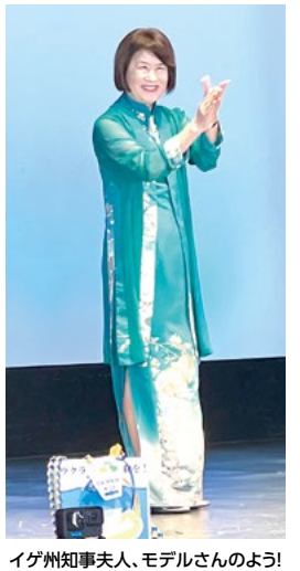
イゲ州知事夫人、モデルさんのよう!

た。目的は、ハワイの人々に日本文化を紹介し、その交流を通じ相互理解を深めること。日本から遠藤周作、平岩弓枝、渡辺淳一、瀬戸内寂聴などの著名作家をハワイに招いて講演会をしたり、日本料理教室、手芸教室、演奏会など多彩な催しを企画し、日本とハワイの交流を深めた。