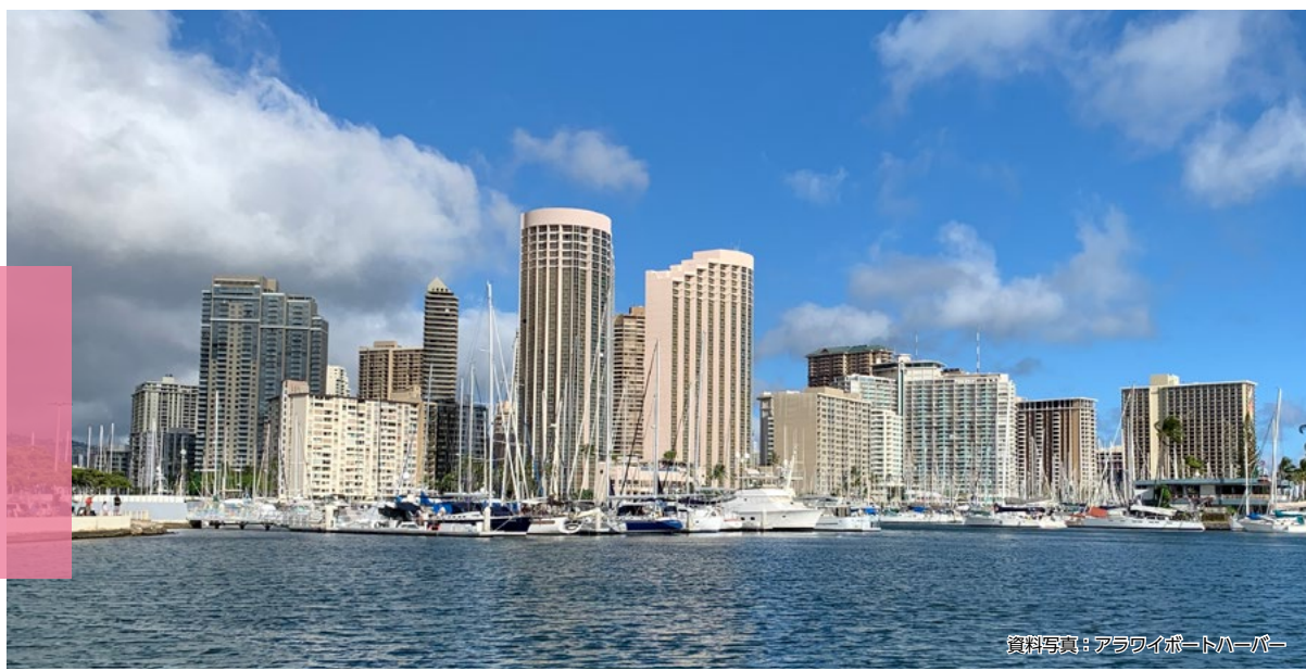
資料写真: アラワイボートハーバー