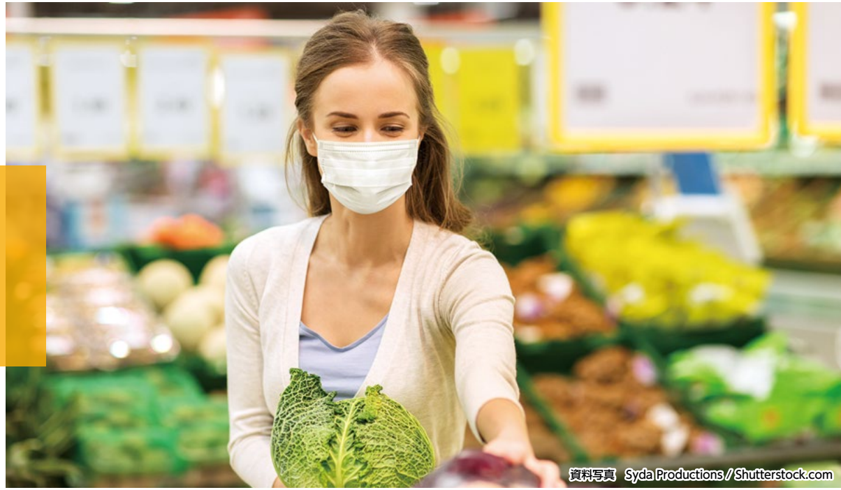
資料写真 Syda Productions/Shutterstock.com