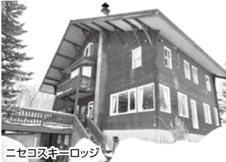
ニセコスキーロッジ