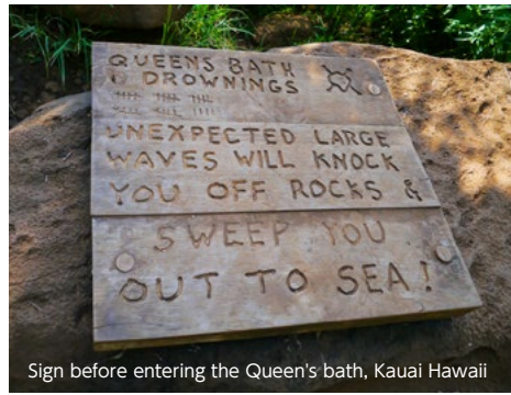
Sign before entering the Queen's bath, Kauai Hawaii

スのアクセスゲートは昨年10月から一時的に閉鎖されている。ゲートの再開は今年春頃の予定。