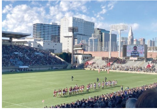
12月末に大学ラグビーを観戦。冬の澄んだ空が気持ちいい!

くする新リーグ開幕ですが、名前やチーム名が正直わかりづらく、リーグシステムも複雑で困惑するばかり…泣。ただ、嬉しいことに「東京ブラックラムズ」は世田谷に初めて誕生するプロのスポーツクラブ。二子玉エリアの多摩川近くにグラウンドやクラブハウスがあり、区民としては応援したいところ。年末にはおしゃべりな街・二子玉で屈強な選手たちが登場するファンイベントも開催され、地域のファン獲得にも本腰を入れています。