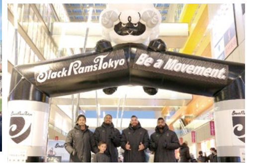
セレブな街・二子玉のショッピングセンターでファンイベントを初開催した「ブラックラムズ東京」。(同チーム公式Twitterより)

を追うラグビーの観戦は、常夏の島・ハワイのスポーツスタイルからはもっとも遠いかもしれませんが。それでも日本の冬の青空の下、スタンドで深呼吸するだけでも素敵な体験。海外渡航がもう少し自由になったら、ぜひ一度ラグビー場を体験してみてください。