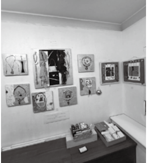
作品名『アステカ文明への夢』

から、タイトルはマグネットアートアクセサリー『アステカ文明への夢』にしてみました。 展示会の案内ダイレクトメールのサブタイトルには、こんな言葉が。 「老年は愉しみに充ちている、もし君がその使い方を心得ているなら。 —セネカ(Seneca)」