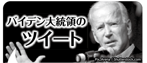
Joe Biden @JoeBiden

キャンペーンの詳細はこちらから。 https://www.allhawaii.jp/htjnews/4940/