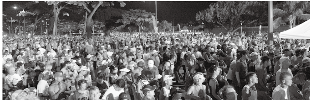
資料写真: Honolulu Marathon 2018 Honolulu Hawaii crowds of runners at start and during the race elite runners to walkers participate because there is no time limit to the Honolulu marathon.

パラハル氏は、開催を決定したブランジャールディホノルル市長、スポンサー企業そして参加する走者のみなさんに感謝していると述べている。 日刊サン12/8(水)配信