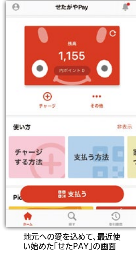
地元への愛を込めて、最近使い始めた「せたがやPay」の画面

なっても、LINEでメッセージを1本送る手軽さで、チャージできて安心。オートチャージでなく、任意の額をPayPayに送金するので使い過ぎも防げ、最近コンビニでの支払いは、ほぼPayPay一辺倒です。