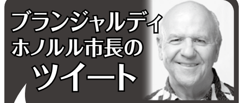
Mayor Rick Blangiardi @MayorRickHNL

https://twitter.com/govhawaii より抜粋して翻訳、掲載しています。