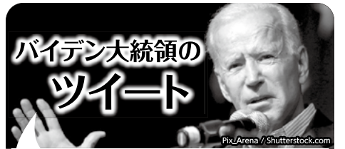
Joe Biden @JoeBiden