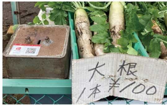
無人販売店の大根も QR 決済できます!

スマホで支払いができるQRコード決済は、私の場合は銀行の口座と連携しており、希望額を瞬時にチャージできるのが本当に便利です。例えばレジでの会計時に「あっ、残高が!」と