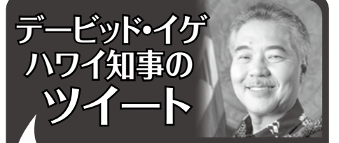
Governor David Ige @GovHawaii

12月7日 9:17AM もし今回の大雨と洪水で自宅や家屋、ビジネスが被害を受けたのなら、被害の状況を証拠として記録し、下記に記したリンク先に報告してください。非常事態宣言が昨日発令されていますので、被害の修復の支援には州の資金が適用されます。 https://honolulu.gov/dem