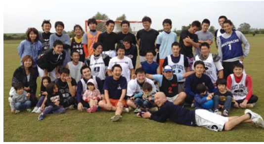
2011年に行われたシルバークロス設立15周年記念イベント。前列でキャップを被ったのが筆者でその前に寝転ぶように映っているのが本誌掲載を勧めた旧友