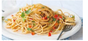
細麺パスタ(カップペリーニ)

この細麺スパゲティーで焼きそば替わりとし、みそ汁を加えて「焼きスパゲティー定食」の出来上がり。おいしくいただきました。