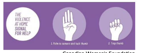
Canadian Women's Foundation

カナダの女性支援団体によると、このサインでは手のひらを外側に向けて親指を内側に折り、残りの4本指で親指を包み込むしぐさをする。これを利用すれば、窮状にある人が片手だけを使って助けを求めることができるという。