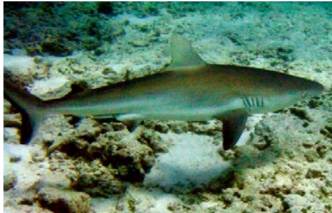
ガラバゴスザメ