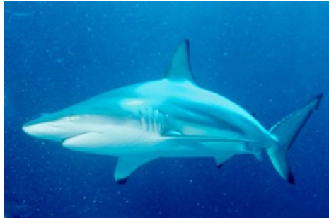
カマストガリザメ

マウイオーシャンセーフティは、サメが現れた地点から1マイルの各方向にサメ出没の警告標識を設置した。周辺の海域はしばらく監視され、警告標識は安全が確認され次第取り除かれるという。