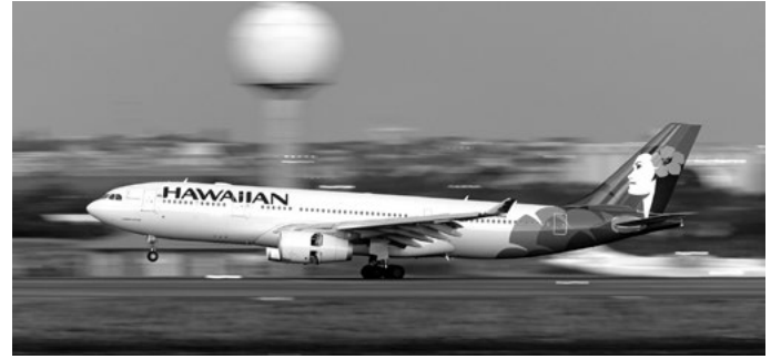
資料写真：Sydney, Australia - October 10, 2013: Hawaiian Airlines Airbus A330 aircraft at Sydney Airport after a flight from Honolulu.

そして12月15日からハワイアン航空452便は、シドニーを火曜、木曜、金曜、土曜、日曜の午後9時40分にシドニーを出発して、午前10時35分にホノルルに到着する予定だ。