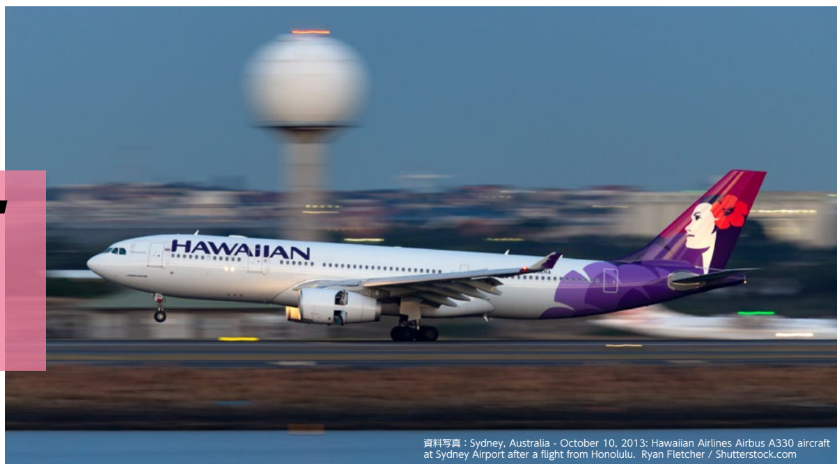
資料写真: Sydney, Australia - October 10, 2013: Hawaiian Airlines Airbus A330 aircraft at Sydney Airport after a flight from Honolulu.