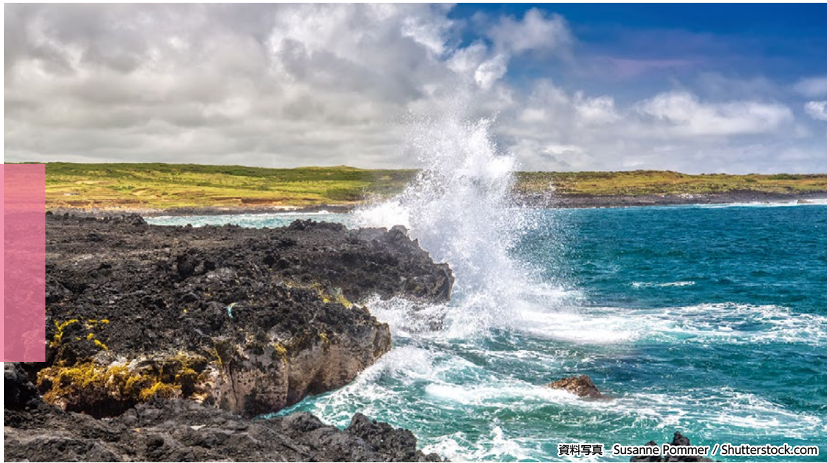
資料写真 - Susanne Pommer // Shutterstock.com